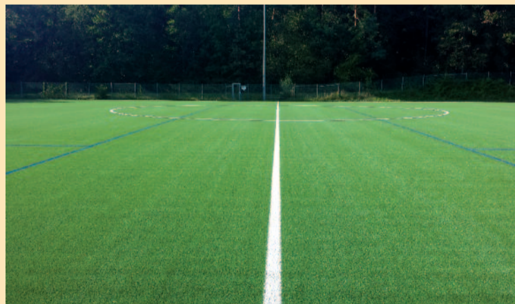
Ein neuer Kunstrasenplatz für den SV Sillenbuch 1892 e. V., 11. Platz beim Bürgerhaushalt 2015