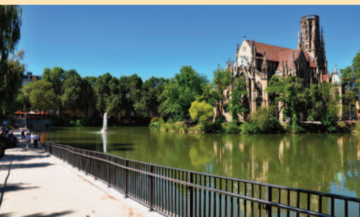
Dreimal von den Bürgerinnen und Bürgern gewünscht, 2016 realisiert: die Sanierung des Feuerseeufers im Stuttgarter Westen