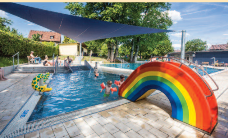
Siegerprojekt beim allerersten Stuttgarter Bürgerhaushalt 2011: das „Bädle“ in Sillenbuch